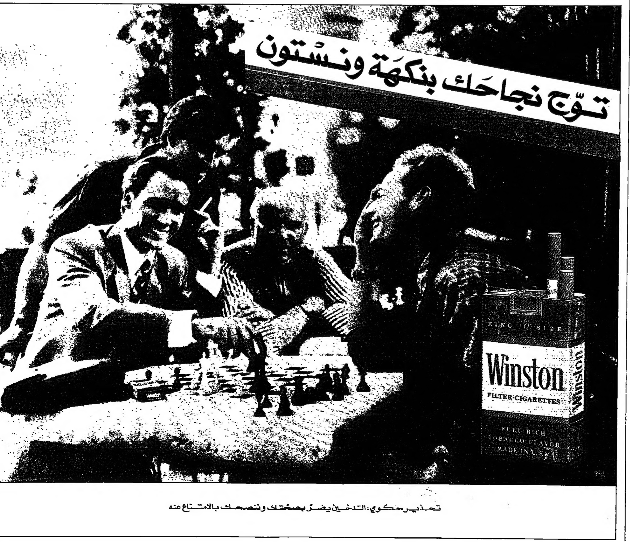
تعددير حكومي، التدخين يضر بصحتك وتصحك بالامتناع منه

وعدم ربطها بها الا برجلتين جويتين اسوعيا، قام الطلاب والعمل في باوتو بتظاهرات صاخبة، استجابة للحركة المطالبة بالديمقراطية العام الماضي في ميدان تيانانمن في بكين. وسئل عامل مصنع الصلب عن رد فعل باوتو لقمع الجيش في بكين، لحركة الديمقراطية في حزيران، فرد قائلا: اننا لا نتحدث عن ذلك، انها مسألة حساسة للغاية. واضاف قائلا قبل ان ينضم الى زملائه، الذين يقومون بمراجعتهم في نهاية نوبة العمل ان عمل الصلب يشغرون بالرضاء بصورة عامة، فهم اهل الناس اجرا في البلدة... ولا يهتم الكثير من العمل بالسياسة ولكنهم يهتمون فقط بشؤون الحياة العملية. وقال مدير مصنع الصلب في باوتو، بعض الفخر انه لم ينضم احد من عماله البالغ عددهم ١١٠,٠٠٠ عاملا الى مسيرات الاحتجاج العام الماضي، ورغم بعد البلدة عن العاصمة،